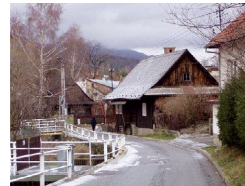
Dům č. p. 78