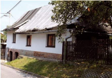
Dům č. p. 8

Cesta ulicí Na Drahách se u domu č. 831 stáčí doleva, k silnici do Valašské Bystřice. Tady se otevírá pohled na panorama Černé hory a Radhoště. Z obou stran silnice, směrem k Rožnovu jsou postaveny nové domy. Z těch starších zmíníme Krhovjácův dům č. 832. Pan Krhovjác byl švec, řemeslo po něm převzal jeho syn Václav. Pan Krhovjác vykonával mnoho let pro děti důležitou funkci Mikuláše.