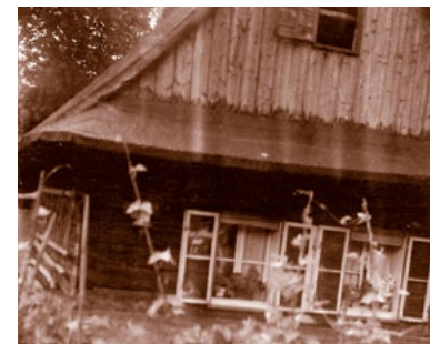
Dřevěnice rodiny Křenkovy

Na levé straně cesty stojí zachovalá část dřevěného stavení č. 69. Dřívější majitel Jaroslav Křenek byl vyhlášený malíř pokojů. Říkalo se, že rodina jeho zákazníka mohla bez obav jíst u stolu, nad kterým pan Křenek líčil strop a ještě všechny bavil svým vyprávěním. Byl to velmi rozšafný a hovorový člověk.