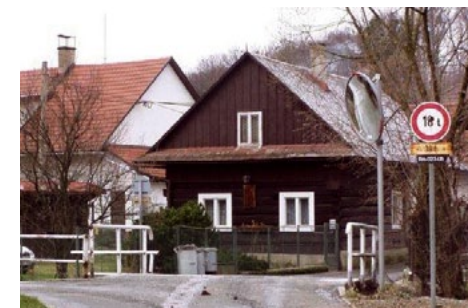
Dům č. p. 77