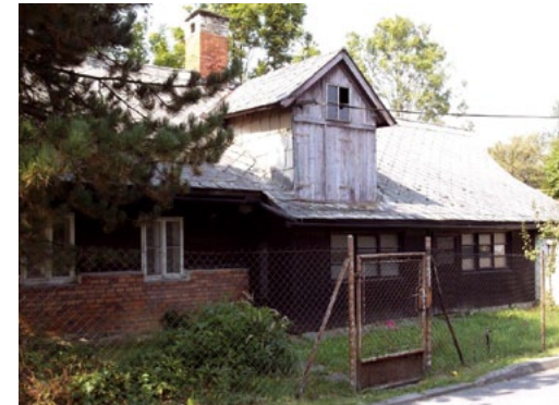
Dům č. p. 84