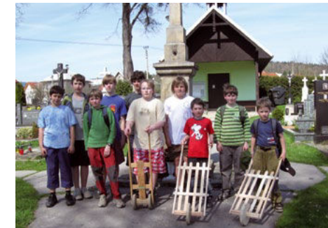
Rapačáři u hřbitova

Jako nehmotné kulturní dědictví zůstali „rapačáři“. Je to zvyk, kdy skupina ogarů obchází o Velikonocích obec a klapotem rapačů (velkých řehtaček) nahrazuje zvonění, neboť zvony podle křesťanských zvyků odletěly do Říma.