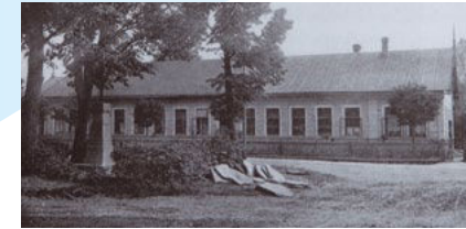
Bývalá pletárna, dnes MŠ