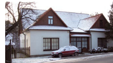
Bývalá hospoda Na Mlýnku

oznámili, že se jeho živnost znárodnuje. Starý pán na další činnost rezignoval. Hospoda zanikla a budova se po opravách stala víkendovým stavením dědiců.