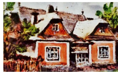
Stará hospoda Na Mlýnku

Rybník za cestou, napájený vodou z potůčku tekoucího z Horeček, sloužil nejdříve jako zásoba vody pro panský mlýn patřící Žerotínům a potom Kinským. Od roku 1881 byl používán k chovu ryb a na ledování pro pivovar v Rožnově. Následně byl vysušen a po roce 1980 postupně zastavěn šesti rodinnými domky. V roce 1922 byla na pozemku zvaném Pod Pecníkem, na místě obecních domků, v nichž přebývali místní chudí, postavena budova obecního úřadu s hasičskou zbrojnicí. V 70. letech 20. století zde byla v akci „Z“ přistavena prodejna Jednoty. Po roce 1989 bylo vše zprivatizováno.