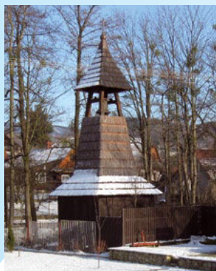
Zvonička v Tylovicích

Zvonička v Tylovicích byla postavena pravděpodobně už koncem 18. století v období tereziánských reforem. Rekonstrukce se dočkala až v roce 2014. Podnes slouží k vyzvánění při úmrtí tylovických občanů.