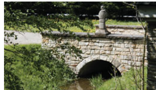
Valašské muzeum – Mlýnská dolina

Po vyučování jsem ráda zašla k mostku a dívala se do struhy, tu a tam jsme s děvčaty pustily po vodě lístek. Vzpomínky mne zavedou také k dřevěné, zeleně natřené budce, ve které se po mnoho let prodávaly noviny a časopisy. Stála jen pár metrů od struhy. Mnoho vody korytem struhy protéklo, mnoho lidí prošlo po můstcích přes ni. Voda otekla, čas běžel, a v něm se naplňovaly různé osudy lidí, ale také osud struhy.“