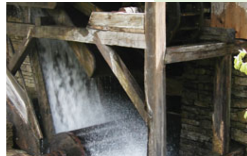
Valašské muzeum – Mlýnská dolina

V polovině 20. století přestala mít voda ze struhy pro místní průmysl význam. Papírny byly posledním průmyslovým zařízením, které struhu používalo. Stroje sice poháněla elektrina, ale k výrobě papíru bylo zapotřebí hodně vody. Tak se papírny musely starat o údržbu celé struhy. Ta byla poměrně nákladná, proto si papírny raději vybudovaly vlastní vodárnu a struhu nadále nevyužívaly.