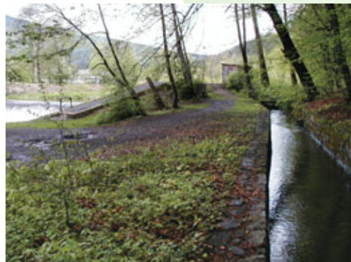
U horního splavu

Lázeňští hosté a návštěvníci města jí říkali „struha“, ale pravověrní Rožnované vždy „struha“. Domácnosti z ní braly vodu na vaření, hospo- dyně ve struze máchaly prádlo, hospodáři napájeli dobytek. Držely se tam ryby a raci. Struhu využívaly husy a kačeny. Koupaly se v ní děti.