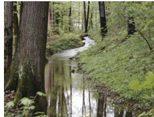
U horního splavu o kus dál

Za horním mlýnem struha protékala pod dnešní křižo- vatkou se sochou Františka Palackého, pokračovala před lékárnou U Matky Boží kolem tak zvaného bludné- ho kamene, minula Bajero- vo hospodářství a ubíhala podél dnešní ulice Na Zahradách a dál před budovou dnešní Integro- vané mateřské školky, kolem domu Farní charity a pod Nádražní ulici, pak přes zahradu Velických, před farou a kolem usedlosti Jakšíko- vých, kde se podnes zachoval už nefunkční betonový můstek.