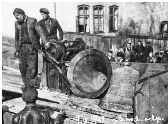
Rekvizice zvonů kostela Všetech svatých, r. 1942

Zvony. Kromě zvonu z r. 1719, který se nám zachoval ještě ze starého dřevěného kostela, byl osud zvonů postupně pořízovaných většinou ze sbírek farníků a často i darů kněží, velice smutný. Dva roky před slavnostním vysvěcením kostela v r. 1762 byly ze sbírek pořízeny tři zvony. Ty byly při velké rekonstrukci kostela v r. 1890 přetaveny a pořízeny čtyři nové zvony. Po vypuknutí války byly tři z nich zrekvirovány a v druhé fázi rekvizice