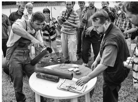
Dokumenty z makovice kostelní věže, r. 2007