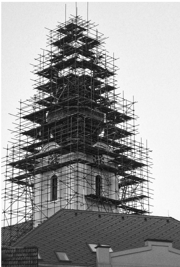
Oprava kostelní věže, rok 2007