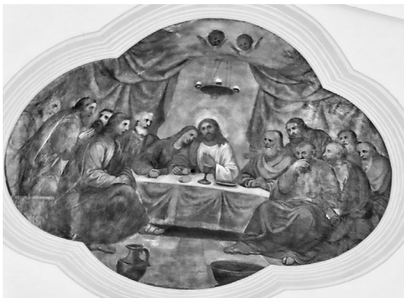
Malba na klenbě kostela Věch svatých, Poslední večeře Páně