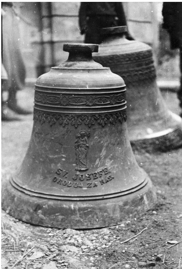
Zvon sv. Josef z roku 1922