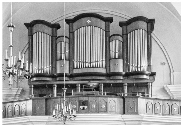
Varhany v kostele Všech svatých