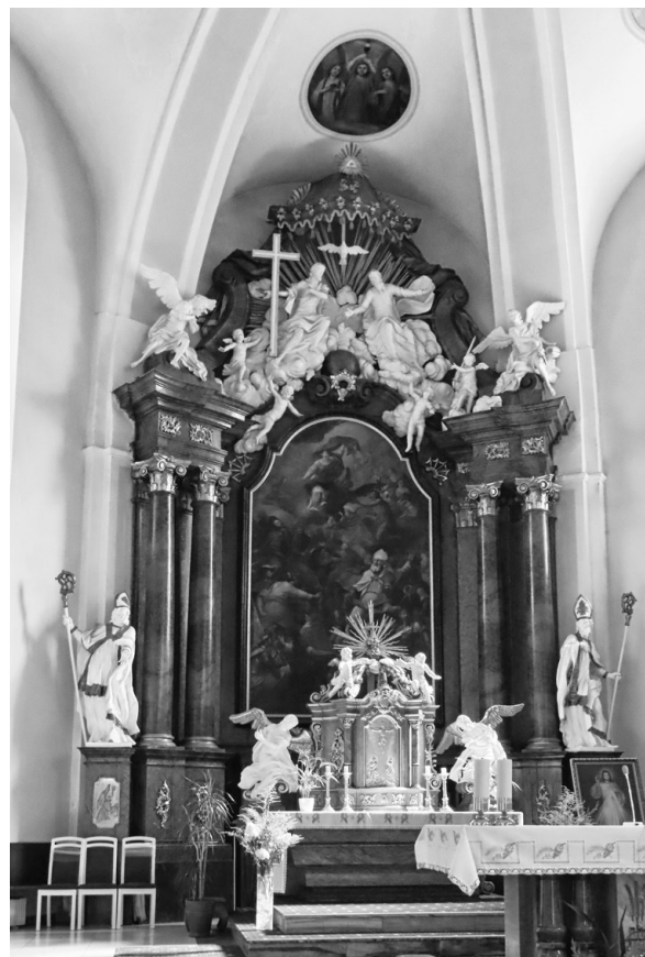
Oltář kostela Všech svatých

Nejcennější v našem kostele je již zmiňovaný oltář s obrazem Všech svatých. Autorství obrazu se připisuje vlámskému baroknímu malíři Anthoni Schoonjansemu. Patřil do školy žáků Petra Pavla Rubense a pracoval pro vídeňský a berlínský císařský dvůr. Hodně cestoval a jeho díla můžeme najít na mnoha místech Evropy. Vyzdobil i kostely na Moravě, např. v Brně nebo v Lechovicích u Znojma. Náš obraz ale nemaloval pro Rožnov, zemřel už v r. 1726. Oltář, i když to tak nevypadá, je celý ze dřeva, fládrovaný, napodobuje strukturu mramoru a postavy andělů jsou natřeny bíle, takže působí jako alabastr. Ve vrcholové části oltáře jsou postavy, které představují Nejsvětější Trojici. Bůh Otec, Ježíš drží kříž a nad nimi Duch svatý v podobě holubice. Pod nimi je v modré barvě zeměkoule, nad nimi trojúhelníkové Boží oko, které znamená Boží vševědoucnost. Dvířka