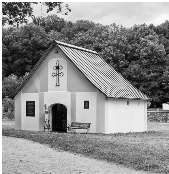
Kostnice u kostela Všech svatých

Kostnice, nebo jak jí obyvatelé říkali márnice, byla postavena přibližně ve stejné době jako kostel, možná i dřív, přesné datum neznáme. Do kostnice se ukládaly kosti dřívě zemřelých při novém pohřbu do stejného hrobu, nebo zemřelí, kteří neměli pohřeb z domu. Márnice po zřízení hřbitova na Prochodné ztratila svůj účel a sloužila jen pro odkládání různých nepotřebných věcí a chátrala. V kostnici byly také odloženy dva vzácné obrazy Vyléčení sv. Pelegrina a Ukřižování Krista, díla moravského barokního malíře Jana Kryštofa Handkeho, která jsou dnes v kostelíku sv. Anny ve Valašském muzeu po stranách oltáře. Také obrazy Křížové cesty, na něž padal prach v kostnici, jsou dnes ve sbírkách muzea. V kostnici byly