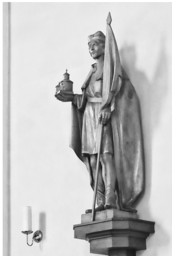
Socha sv. Václava od sochaře Emila Solaříka