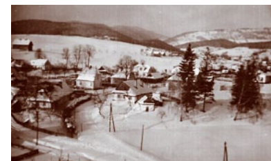
Hradištko Bačův vrch