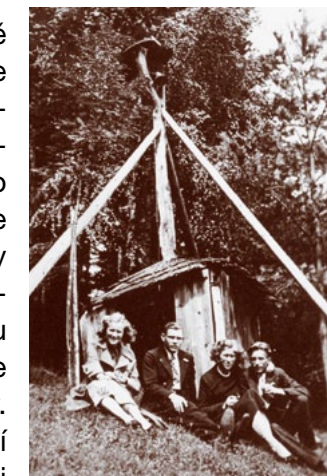
Zvonice u Jakšíků