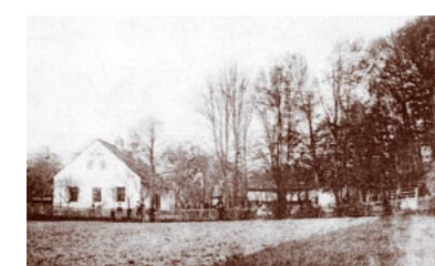
Rosinka – Řecká restaurace 1906