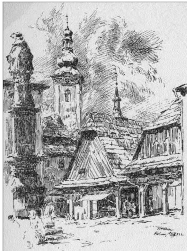
Kresba K. Wellnera z r. 1922: Náměstí se sochou sv. Jana Nepomuckého, postavenou r. 1722.