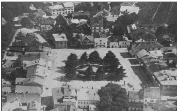
Rožnovské náměstí z roku 1923.