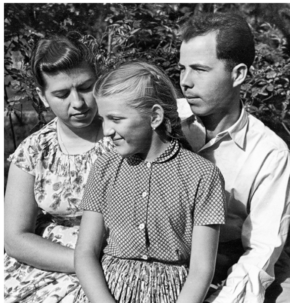
Maminka, tatka a já desetiletá

V roce 1945 od února do března byl totálně nasazen na nucené práce, kde za každého počasí kopal zákopy v oblasti Polského Těšína. Podmínky tam byly velmi tvrdé – hromadné ubytování, strava jen 2x denně a to mizerná, a práce bezplatná. Nad nimi stálý vojenský ozbrojený dozor. Když „akce“ skončila, odcházel tatka pěšky do Ostravy a pak vlakem do Prahy, kde téměř bezprostředně vypuklo Pražské povstání, a tak vypomáhal se stavbou barikády. Později využil nabídky n. p. Tesla a přestěhoval se do Rožnova pod Radhoštěm. Začínal pracovat jako mistr na dílně ve výrobě elektronek.