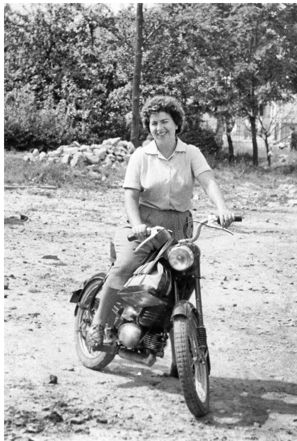
Maminka na Pionýru

Den tím ale nekončil. Večer sedla maminka k výkazům a vypisovala každodenní evidenci – jméno ženy a dítěte, které navštívila, co se projednávalo,